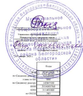
Раздел 1. Поступления и выплаты

муниц. бюджетное общеобраз. учреждение "Лицейская сред. общеобраз. школа Новоскоп. рай. Белгород. обл."