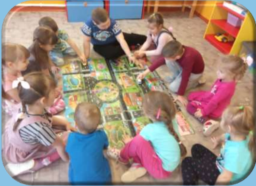
Аппликация ООД «Машины едут по улице» (коллективная работа)